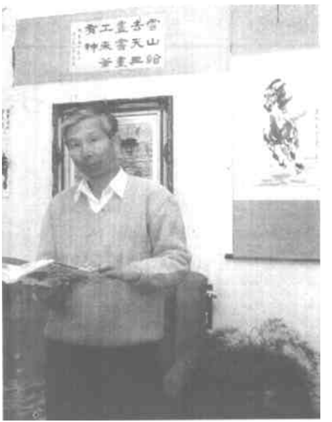
进艺术之门，其中有不少人成为省市小有名气的画家。

乃集先生为人真诚、待人随和，除沉迷于绘画创作之外，把剩余精力全部用在了培植艺术新人上。自恢复高考以来，他利用业余时间，义务辅导了大批学生，先后把20余名美术爱好者送入艺术院校，踏